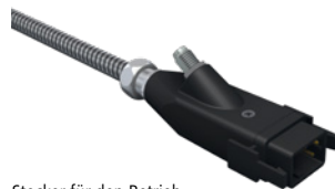
Stecker für den Betrieb an Fremdsystemen