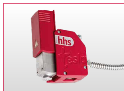
tesla go配有可拆卸式隔热套