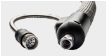
Schlauch mit integrierter Übertemperaturabschaltung und Schutzgrad IP 54