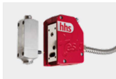
Ventil mit steckbarem Modul