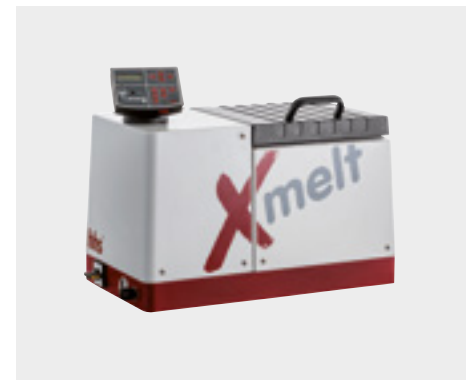
X-melt Schmelzgerät 4 kg

Die Heißleim-Schmelzgeräte bilden in Verbindung mit X-melt Heißleim-Schläuchen und -Ventilen ein Heißleim-Auftrags-System. Das zentrale Schmelzgerät erkennt alle angeschlossenen Baugruppen und optimiert automatisch die Systemparameter. So wird das Einrichten des Systems für Sie einfacher, sicherer und schneller. Die X-melt Schmelzgeräte bringen Klebstoff-Granulat schonend in flüssige Form und regeln die Prozessdrücke sowie Temperaturen im gesamten System.