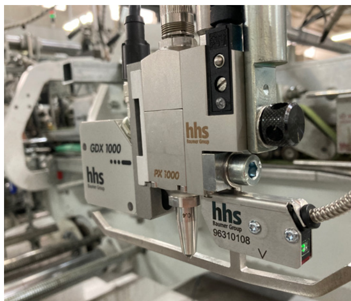
La combinazione ideale: testa di applicazione colla a freddo PX 1000 e sensore colla a freddo GDX 1000