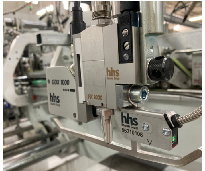
理想的组合：PX 1000冷胶喷枪搭配GDX 1000冷胶传感器

PX 1000拥有的所有优势都有助于提高生产可持续性。其卓越的喷胶性能和启动性能显著减少生产浪费，防止纸盒内粘的风险。PX 1000融合了Baumer hhs专为包装生产过程开发的多项创新技术。