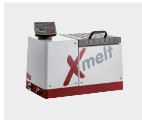
Equipo fusor Xmelt de 4 kg

Los equipos fusores de cola caliente, en conjunción con las mangueras y las válvulas de cola caliente Xmelt, constituyen un sistema de aplicación de cola. El equipo fusor central detecta todos los grupos constructivos conectados y optimiza automáticamente los parámetros de sistema. De esta forma, el ajuste del sistema es mucho más sencillo, rápido y seguro para usted. Los equipos fusores Xmelt transportan el granulado adhesivo en forma líquida y regulan la presión de proceso y la temperatura en todo el sistema.