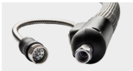
Manguera con desconexión integrada de sobretemperatura y clase de protección IP 54