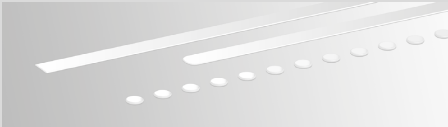
Modo de aplicación de cola en puntos y cordones

Con el controlador por microprocesador Xpect y la válvula electromagnética de cola caliente tesla es posible programar los patrones de aplicación de adhesivo que se deseen relacionados con un producto.