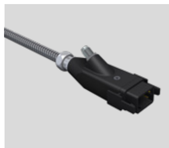
Conector para el funcionamiento en sistemas remotos