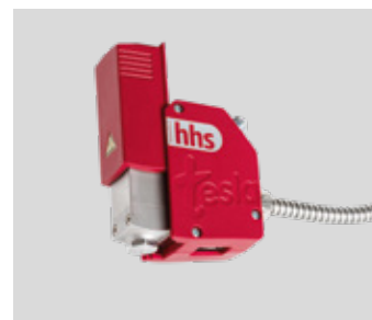
tesla go con aislamiento de módulo abieto