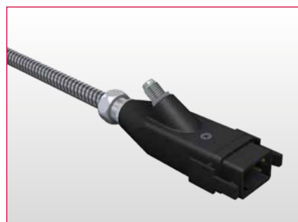
Connettore per il funzionamento con altri sistemi