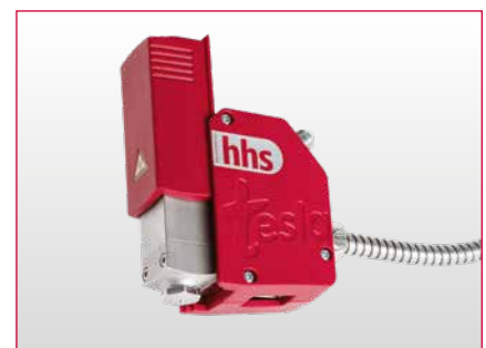
tesla go con isolamento aperto